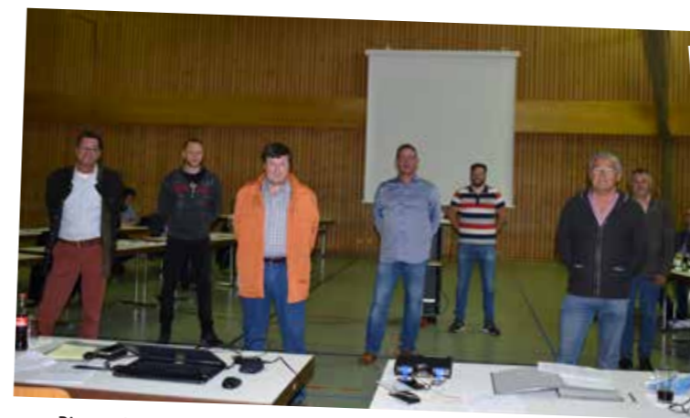
Die verabschiedeten Marktgemeinderäte