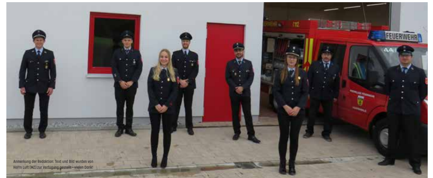
Anmerkung der Redaktion: Text und Bild wurden von Herrn Luft (MZ) zur Verfügung gestellt - vielen Dank!