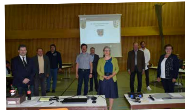
Die "neuen" im Marktgemeinderat