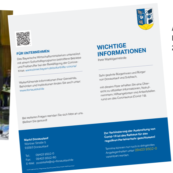
Auch das ist ein Bild des Jahres 2020.