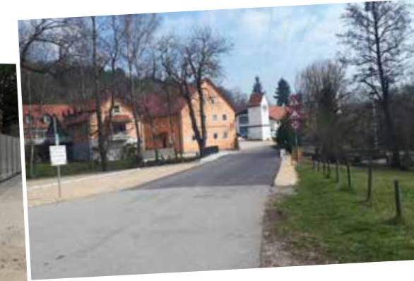
Die sanierte Brücke Hammermühle