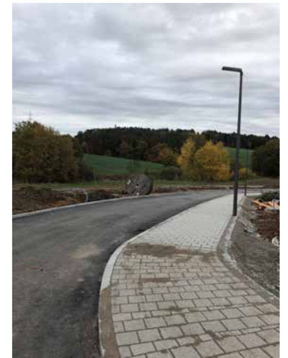
Im neuen Baugebiet „Altenthann - Ost II“ wurde die Asphaltsschicht aufgebracht. Die Vermessung erfolgt seit mitte November.