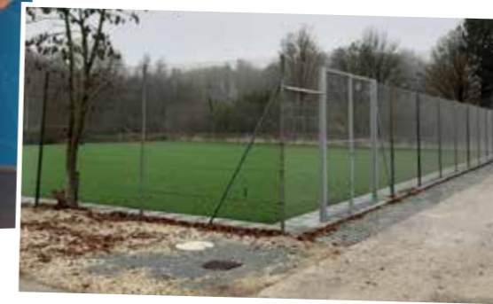
Der neue Kunstrasenbolzplatz