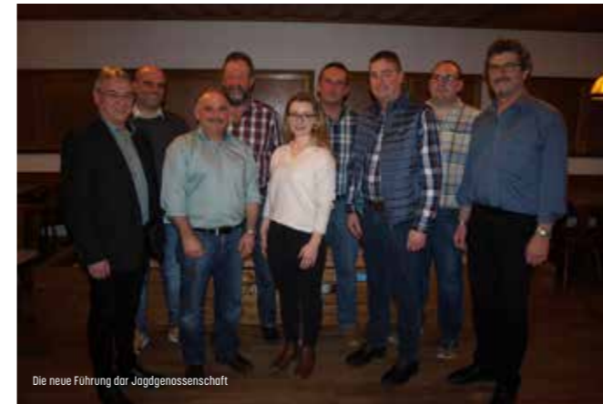
Die neue Führung der Jagdgenossenschaft