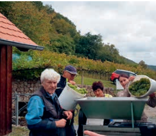
Die Weinlese als Höhepunkt eines jeden Winzerjahres.

Bach. Das Corona-Virus machte auch vor dem Baierweinemuseum nicht halt. Der für März geplante Rebschnittkurs musste abgesagt werden, ebenso die Museumseröffnung am 1. Mai sowie das traditionelle Federweissenfest im September. Auch der Kulturabend im August und das zuvor geplante Sommerfest fielen dem Virus zum Opfer. Trotzdem lag der Beirat des Fördervereins und viele seiner Mitglieder in dieser Zeit des „Stillstandes“ nicht auf der „faulen Haut“. Im Gegenteil, sie waren aktiv tätig und machten in der Pandemie das Beste daraus. Auf zahlreiche Schultern und in mehreren Arbeitsschritten verteilt, bekam der Museumsweinberg im Frühjahr doch seinen gewohnten Schnitt. Dazu half auch die Beschaffung eines Schlegelmulchers, der viele Arbeitsschritte ersparte und das geschnittene Rebholz als natürlichen Dünger gleich zwischen den Reihen der Weinstöcke einarbeitete. Erfreulicherweise mussten die Kurse zu den vielfältigen Arbeiten im Jahr eines Winzers, die der Förderverein anbot, nicht abgesagt werden. Im Weinberg waren die Corona-Vorgaben gut einzuhalten. Unter dem Motto „Tradition braucht Pflege“ versammelten sich zu den sieben Kursen immer mehr als zwanzig Personen, um vom geschulten Personal des Fördervereins unterrichtet zu werden. Das steigende Interesse an den Kenntnissen und Erhalt des Weinbaus in der Baierweinregion