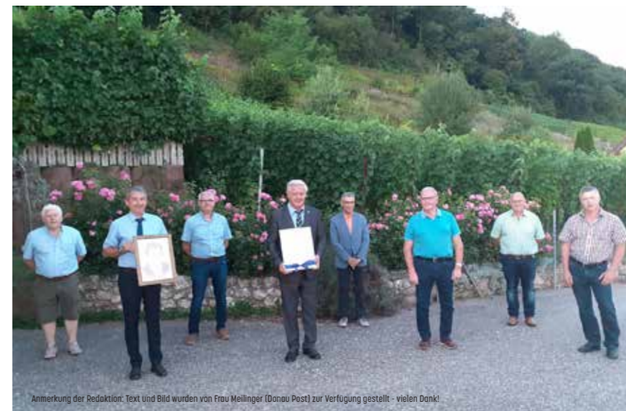
Anmerkung der Redaktion: Text und Bild wurden von Frau Meilinger (Donau Post) zur Verfügung gestellt - vielen Dank!