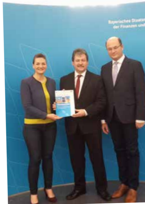
Entgegennahme der Förderbescheide aus den Händen von Finanzminister Füracker und der Ministerin für Digitales Gerlach