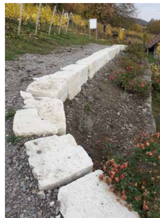
Die neue Steinreihe sorgt einerseits für Sicherheit und bietet andererseits zusätzlichen Platz für Veranstaltungen.