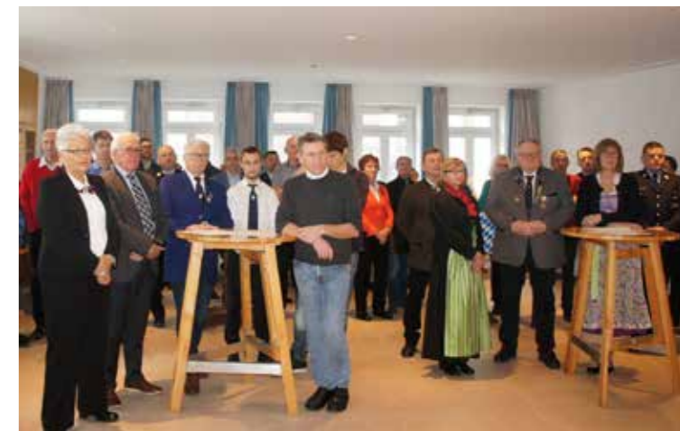
Vereinsvertreter, Neubürger und die gemeindlichen Mitarbeiter nahmen die Einladung zum geselligen Beisammensein gerne an.